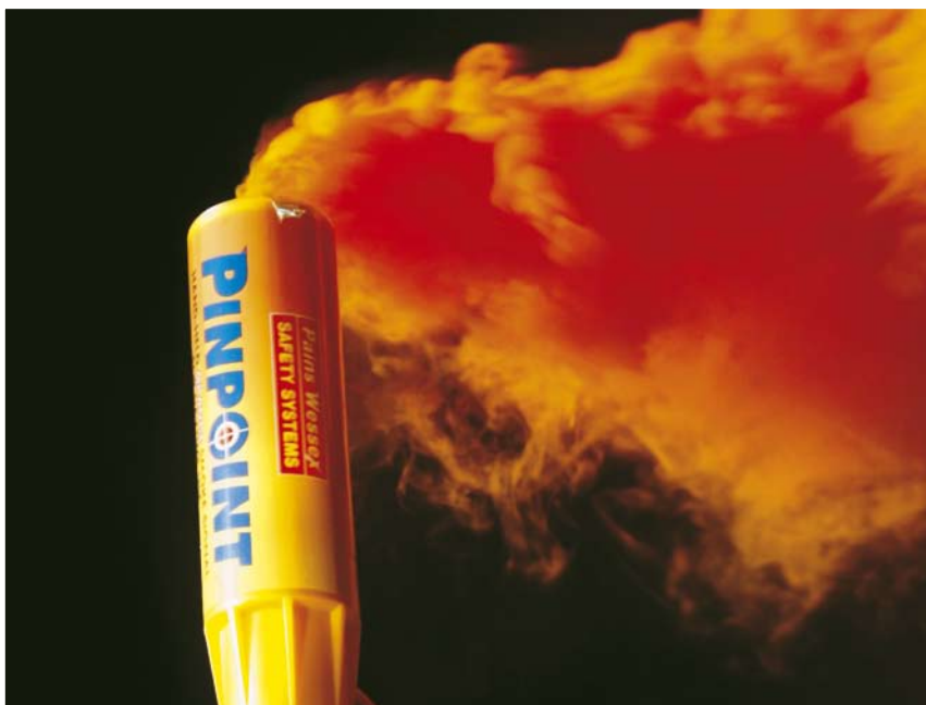
Knop omdraaien, klap geven en roken maar.

Na die periode wil je ervanaf. Afsteken met oudjaar is de meest gebruikte manier. Wat betreft de rooksignalen en de handfakkels bestaat daar geen bezwaar tegen. Ze ontploffen (hopelijk) niet, maar met de parachutefakkels ligt het anders. Ze zijn gemaakt voor gebruik op water en daar is het niet erg als er een gloeiende rest neerkomt. Op het land kan dat gloeiende stukje iets in brand steken en afgelopen jaren zijn met de parachutefakkels dan ook een paar ernstige ongelukken gebeurd. Zo brandden er een aantal winterbergingsloodsen met zeil- en motorboten af. Oude noodsignalen kun je inleveren bij het chemisch depot van de gemeente.